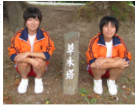
高年さ鈴中市間で(か日 橋生ん木学立`の金ら(九 ) (美校第米四)十火月 知と三緒の三沢日ま日七 (三年生)

が職場体験に来ました。敬老会で使う花紙折りやコミセン施設の掃除、田沢福寿会との交流(輪投げやグラウンドゴルフ)、草木塔を見学しながら周辺のゴミ拾い等を一生懸命行ってくれました。四日間、私たち職員も中学生と楽しく仕事をさせて頂きました。